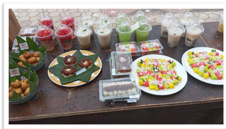
Gambar: Karya masakan berupa lauk pauk, kue basah dan kue kering juga minuman kekinian.