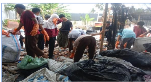
pemilahan sampah organik dan non organik

Pengolahan sampah organik menjadi pupuk organik cair dan kompos. Pengolahan sampah an organik menjadi biji plastik dan briket. 2). Kegiatan kewirausahaan: menjual hasil karya siswa berupa Kompos, pupuk organik cair, briket, biji plastik, barang rongsok (ditimbang dijual ke pengepul rongsokan). 3). Kegiatan Bazaar: pengolahan aneka masakan berupa lauk pauk, jajanan khas daerah, aneka kue basah dan kue kering, dan aneka minuman kekinian.