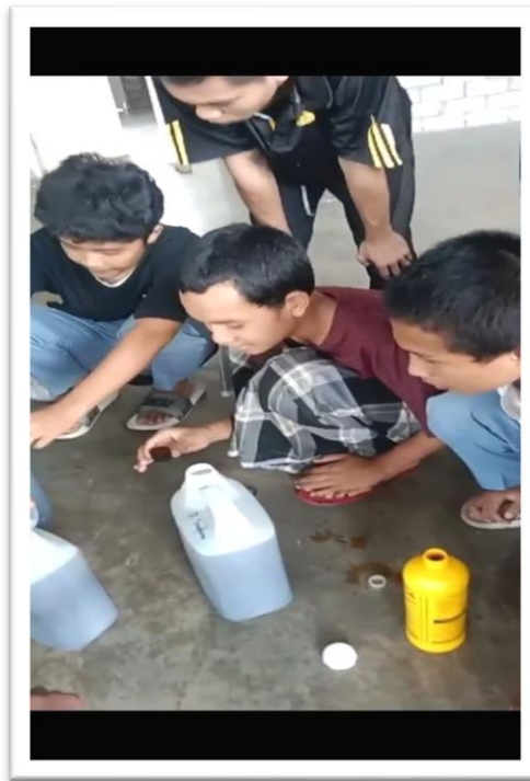
Gambar: Pengolahan Pupuk Organik Cair

P5 Pengolahan Kompos dan Pupuk organik cair.