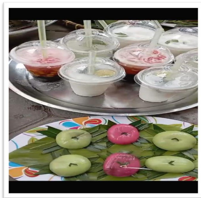
Gambar: Kue basah dan Minuman di Market Day

Sangat disayangkan dikarenakan waktu persiapan pada hari H terasa mendesak karena Market Day dibuka jam 08.00 maka kelas ini tidak sempat menata karyanya di atas meja dan mereka juga belum memasang meja di area Market Day pagi itu.