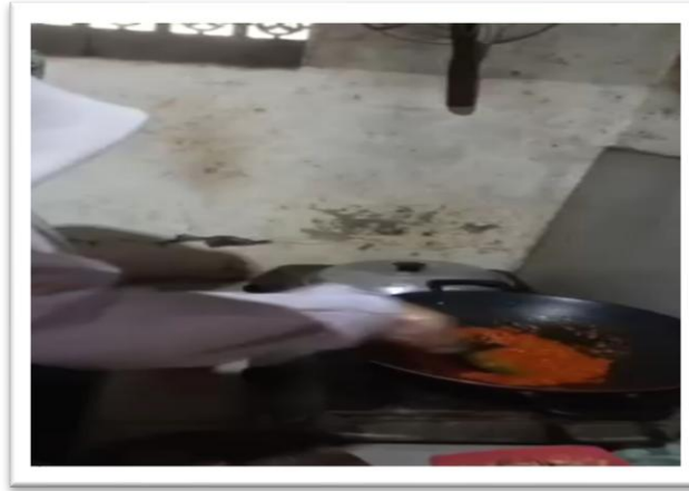
Gambar: Memasak Aneka Lauk Pauk

Disamping membuat kue kue kering dan kue kue basah para siwi juga memasak lauk pauk: